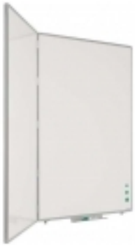
Tableau d'écriture 3 faces